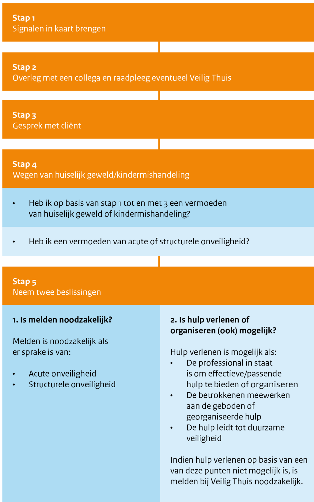
Figuur 1: Stappenplan verbeterde meldcode

Zie hieronder het duidelijke overzicht van het stappenplan van de verbeterde meldcode.